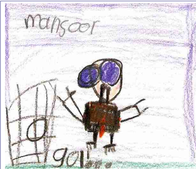
groep 3-4 b