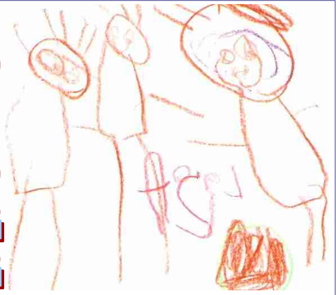
groep 0-1-2 b