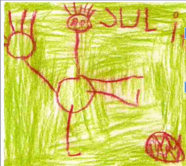
groep 0-1-2 c