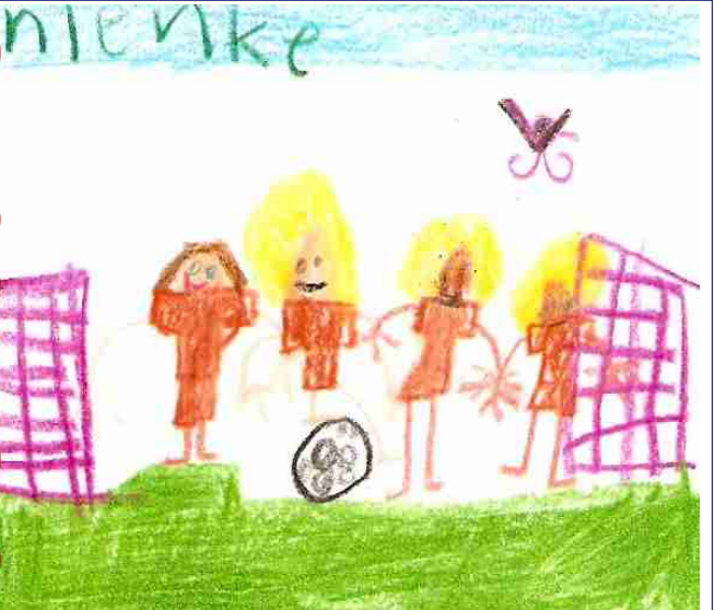
groep 3 a