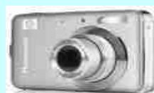
foto-albums - Onze website kent meerdere foto-albums van leuke activiteiten die ongeveer twee tot drie maanden blijven staan en dan weer verwijderd worden. Als u een leuke foto ziet en wilt hebben, moet u daar op klikken. Dan komt de foto groter in beeld. Op dat ogenblik kan deze via de rechtermuisknop gekopieerd of opgeslagen worden.

Cartridges - Heeft u lege cartridges, breng ze dan naar school (bij Janno). U bewijst het milieu er een goede dienst mee. Op school ontvangt de Thijsjesraad (zie ook blz. 8) hierdoor een bedrag voor hun activiteiten. Twee vliegen in één klap dus! Alvast bedankt!